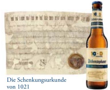
Die Schenkungsurkunde von 1021

Am 14. November 1021 lässt Kaiser Heinrich II. in der Nähe des Königshofes Mering die Schenkung eines Teils der damaligen Donau-Halbinsel „Sachsen-gang“ an das Kloster Weihenstephan beurkunden. In dieser Urkunde wurde Mering erstmalig erwähnt. Daher feierte der Markt Mering auch im letzten Jahr sein 1000-jähriges Bestehen – zumindest im Stillen, da Corona keine richtigen Feiern zuließ. In diesem Jahr werden nun die offiziellen Feierlichkeiten nachgeholt: Zu diesem besonderen Anlass soll es auch ein besonderes Bier aus unserer Brauerei geben. Die einzigartige historische Verbindung machte uns die Auswahl